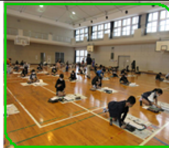
1年生のたごあげの様子 3年生の書き初め会の様子 5年生の書き初め会の様子